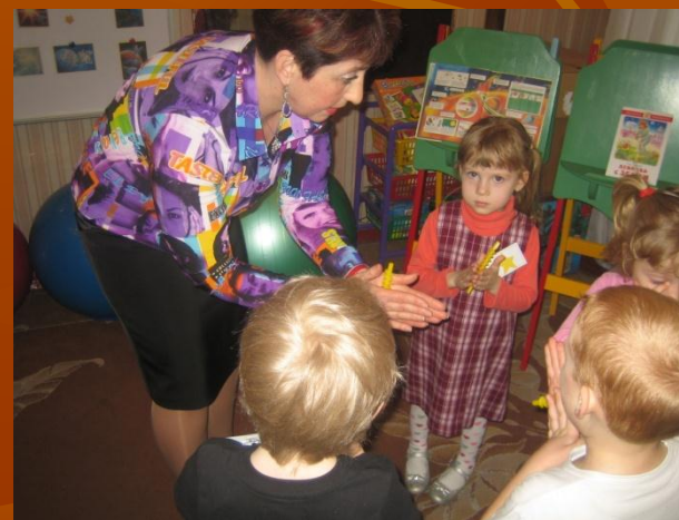
Массаж пальцев рук «Космическими веретёнцами»