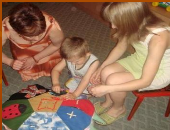
Развитие ручного праксиса