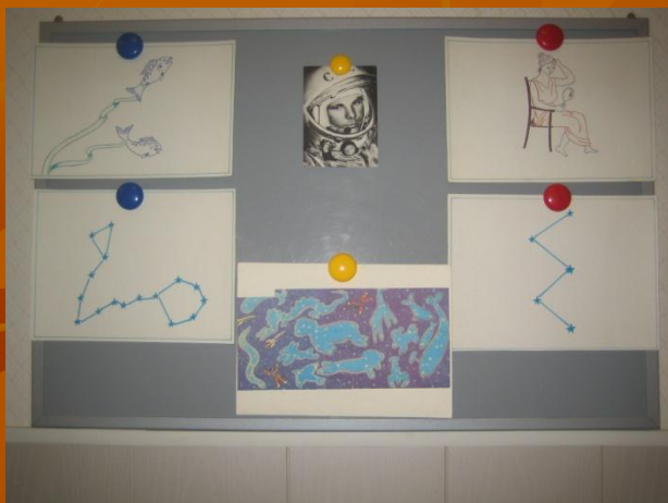
Схемы-карты созвездий «Рыб», «Кассиопеи»