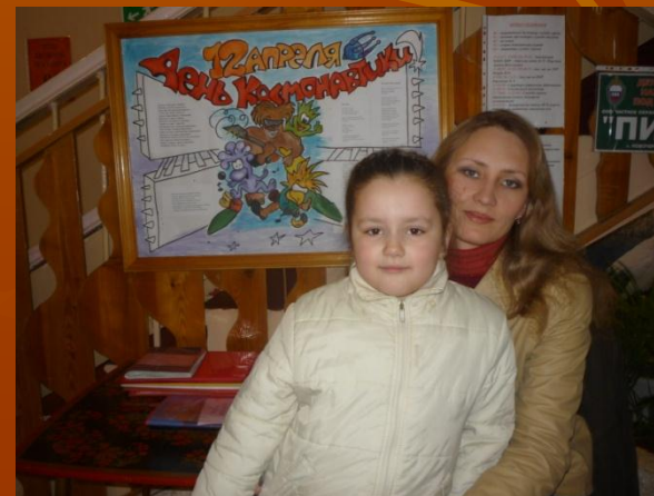
Стенгазета «12 апреля» семьи Бутырских