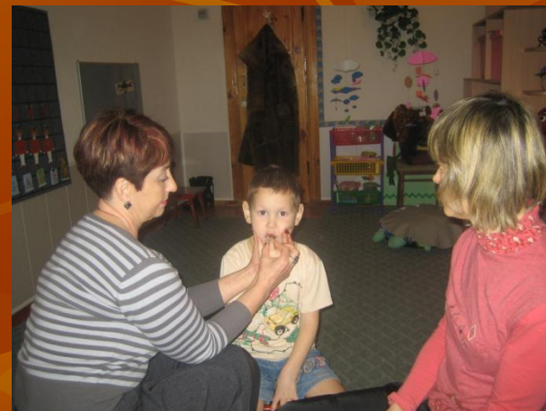
Выработка вибрации кончика языка