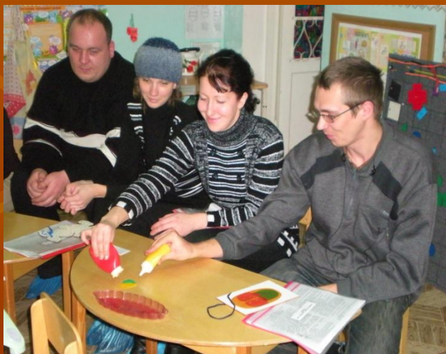
Регуляция силы надавливания