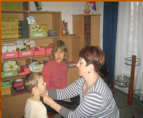
Тренинг по выполнению артикуляционных упражнений