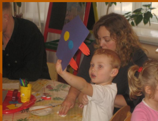
Изготовление объемной «Ракеты»