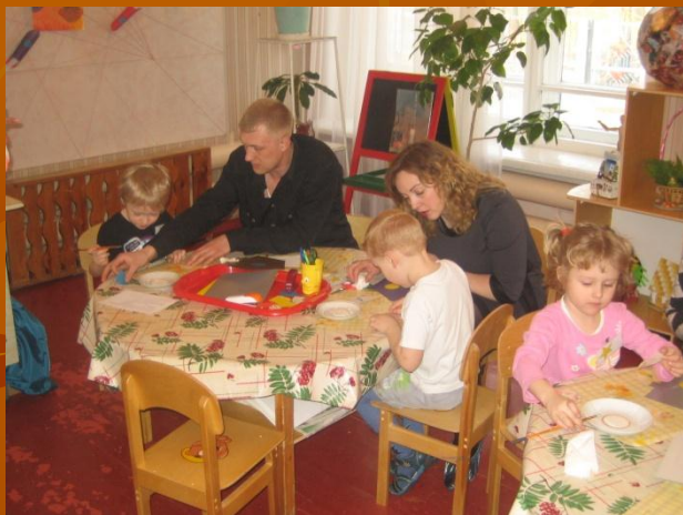
Занятие с родителями «Готовимся к полету»