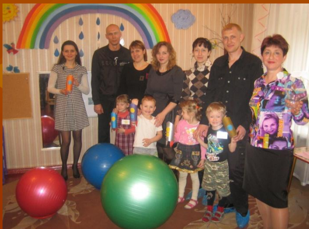
«Ракеты» готовы к полету занятие с родителями «Готовимся к полету»