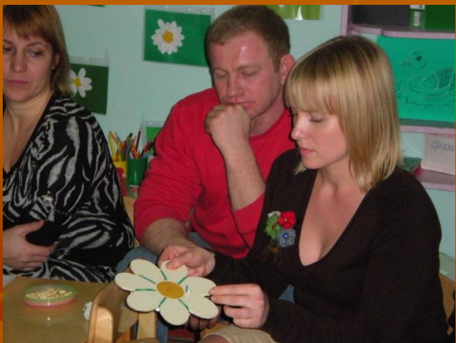
Развитие мышечной силы пальцев рук