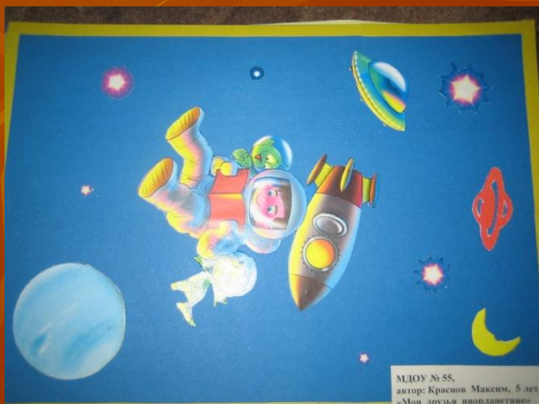
Аппликация «В космосе» семьи Красновых