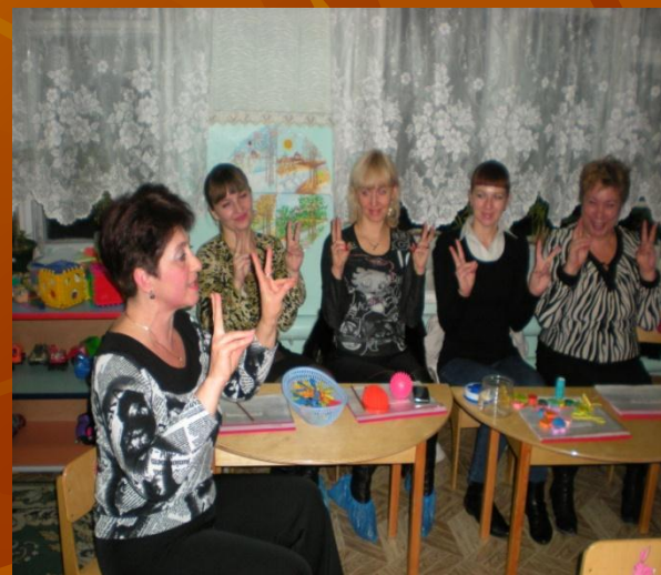
Рассказывание сказки с помощью пальцев рук