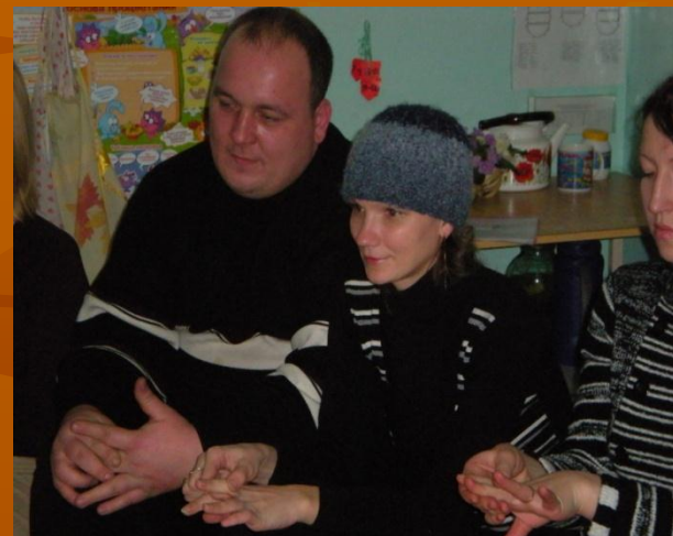
Массаж пальцев рук