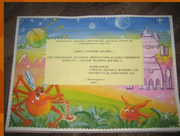
Книга «Добрый космос»